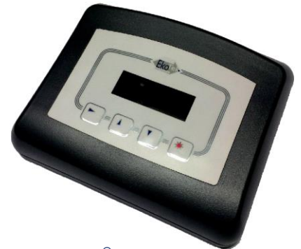
EkoSecure® Notrufzentrale ESHUB mit diversen Schnittstellen

Neben der Übertragung der Alarme an die Notrufzentrale ESHUB und an die mobilen Notsignalgeber ESPAG ist auch eine Weiterleitung in das interne PC-Netzwerk möglich. Der eingehende Alarm bewirkt sofort die Anzeige des Notrufs mit Absender der Nachricht (Gerät), Standort und Aktivierungsart (Druckalarm, Lagealarm, Panikalarm). Gleichzeitig erfolgt eine deutliche akustische Information.