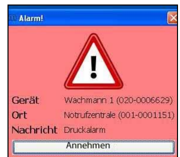
Rufübertragung auf das interne PC- Netzwerk