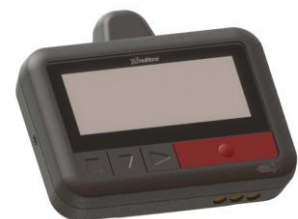
Notruf-Pager ESPAG mit Display und allen Alarmfunktionen (Schutzart IP67)